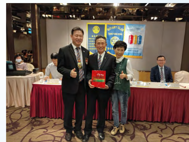
本月結婚週年快樂